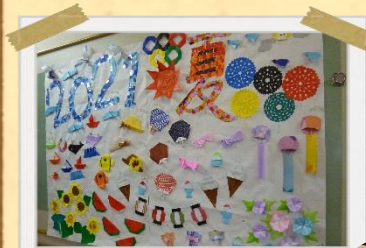
★カラフルな折り紙作品★