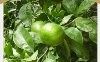
中庭「エデン」のミカン まだ緑色ですが今年は豊作の予感...