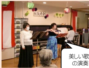
美しい歌声とフルートの演奏でお祝い♪