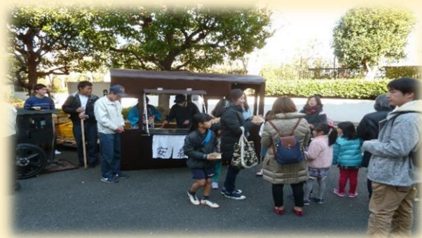
↑ 昨年度やきいもホクホク DAY の様子

「NPO 法人ホサナ 地域活動支援センタークラブハウスシンプルライフ」 が運営する喫茶です。